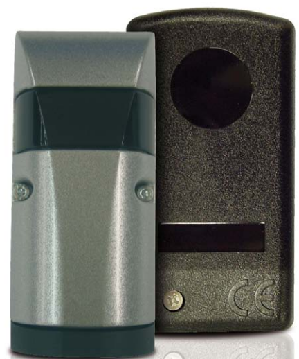
NEOCELL-20NL · NEOCELL-15M NEOCELL-40M

Lichtschränken zur Feststellung von Hindernissen bei der Torbewegung. Sie lösen im Gefahrenfall ein sofortiges Anhalten aus.